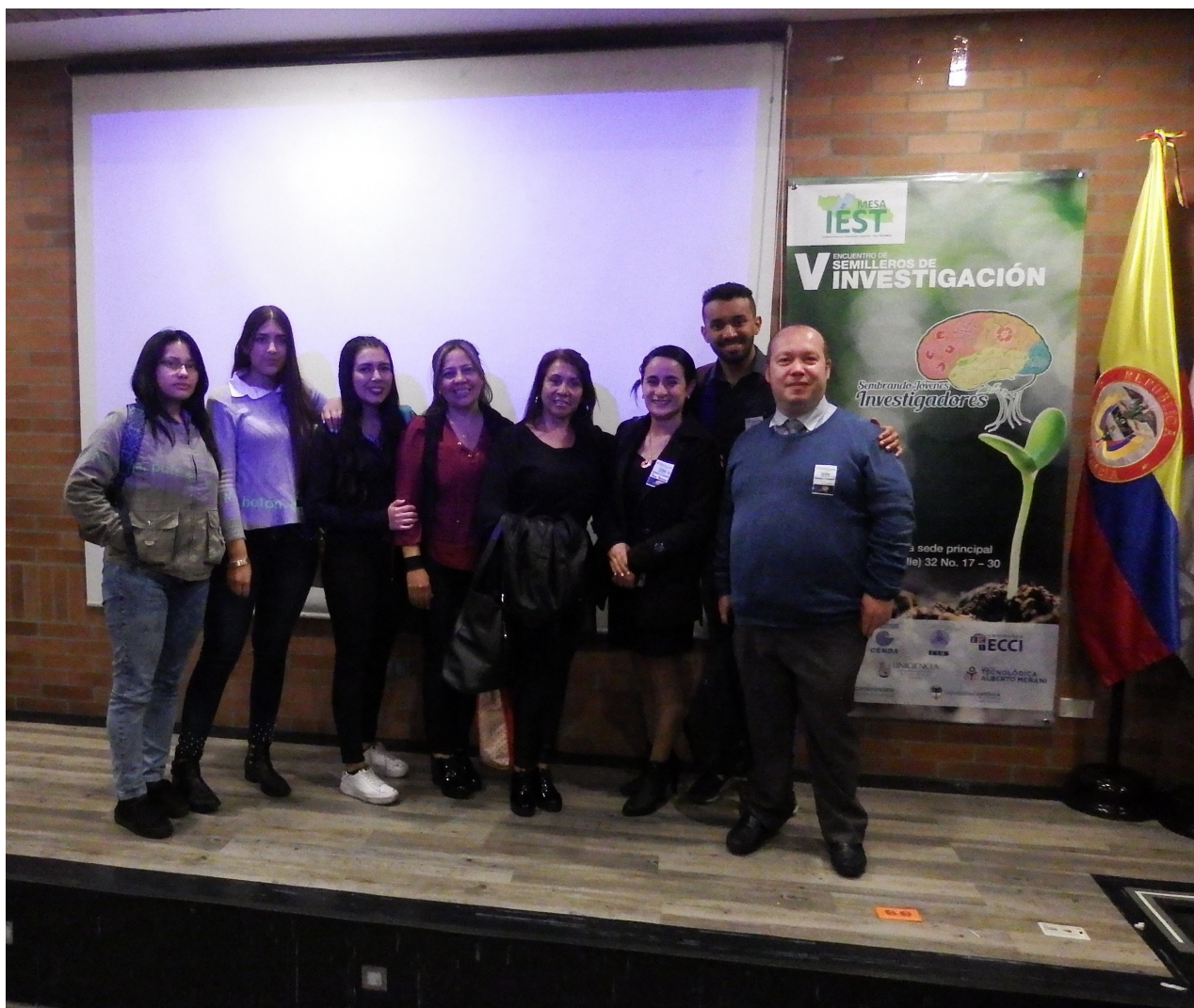
Delegación de la Corporación ISES que participó en el V Encuentro de Semilleros Mesa IEST, en la Institución UNIPANAMERICANA

La Mesa IEST es una Red que convoca a una decena de instituciones de educación superior de Teusaquillo, Barrios Unidos y Chapinero quienes trabajan en cuatro dimensiones cada una con objetivos específicos y de interés para las diferentes universidades y corporaciones. Una de esas dimensiones es la Académica, integrada por ISES, TEINCO, Fundación San Mateo, Merani, Unipanamericana, Uniciencia, Universidad ECCI, CENDA, entre otras, las que bajo la Dirección Ejecutiva y con el apoyo decidido de las Rectorías, han organizado una serie de actividades en beneficio de nuestras comunidades y en especial de nuestros estudiantes y docentes investigadores.