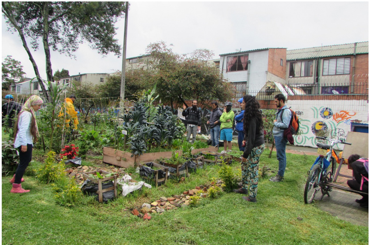
Aproximación a la comunidad por parte de los Colectivos Somos Uno y Biciutopia.

Ante el contexto esbozado, se hace necesario la construcción de alternativas educativas, políticas, económicas y culturales colectivas que no continúen la reproducción