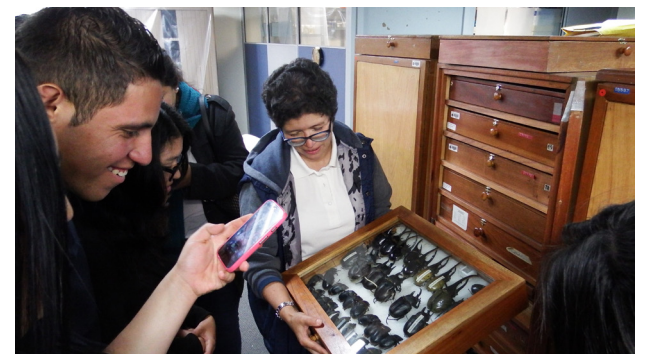
Diferentes momentos de la visita al Museo Entomológico de la Universidad Pedagógica Nacional.