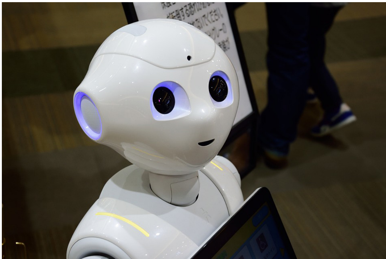
Robot para brindar información en Centro Comercial.

Japón es un país que en el papel es pobre, no posee recursos naturales, está posicionado en una zona de alta actividad sísmica, su tierra no es lo suficientemente fértil para alimentar a sus 127 millones de habitantes y fue el epicentro de una de las peores guerras en la historia humana. Después de quedar devastados por la guerra, los japoneses capacitaron en el exterior a un sector de la población en países desarrollados en innovación, y en gran parte fueron esas personas que al volver lograron cambiar la mentalidad en el país y sacarlo adelante a pesar de las difíciles condiciones en las que se encontraban. El pueblo japonés aprendió a ver las dificultades como oportunidades, sabían que no tenían materias primas para comercializar, por lo que decidieron innovar para crear productos a través del uso de la tecnología. Con décadas de esfuerzo y disciplina, la innovación no solo fue una herramienta para el crecimiento económico del país, poco a poco logró convertirse en un elemento clave de su cultura, y es en ese proceso donde nacieron empresas como Toyota, Mitsubis-